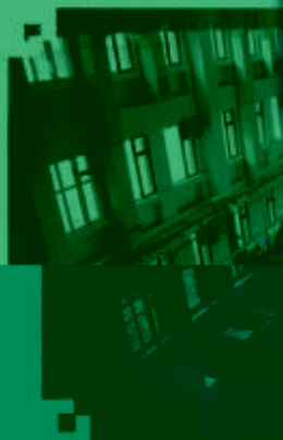
PLC 控制技术 训练场所